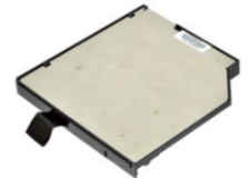
Съемный SSD накопитель в слот расширения