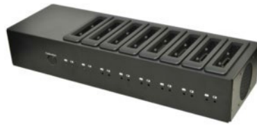
Зарядное устройство на 8 батарей