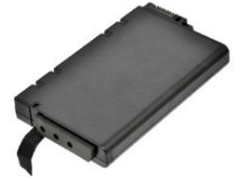
Запасная основная батарея