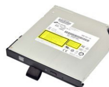
Съемный DVD Super Multi