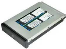
Быстросъемная корзина с SSD накопителем