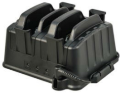
Зарядное устройство на 2 батареи