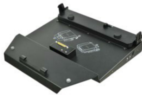
Док-станция для офиса