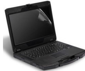
Защитная пленка на экран