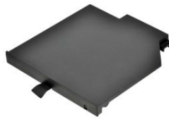
Съемная батарея в слот расширения